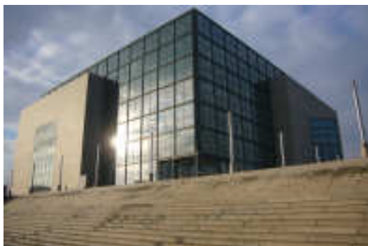
Kroatijos nacionalinė ir universiteto biblioteka