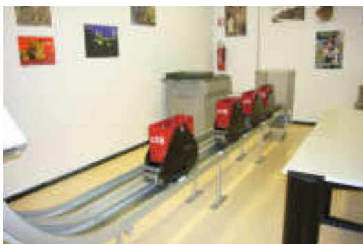
Knygos keliauja į skaityklas

Informacijos aprūpinimo skyriuje susipažinta su skaitytojų informacinio aptarnavimo procesu, atvirų fondų išdėstymo specifika, aplankytos specializuotos skaityklos. Kadangi biblioteka vykdo ir universitetinės bibliotekos funkcijas, Informacinio aprūpinimo skyriaus darbuotojai studentams ir universiteto dėstytojams teikia ne tik įprastas, bet ir papildomas paslaugas. Nustato citavimo indeksą, moksliniam darbui sudaro bibliografinį sąrašą ir kt. (paslaugos nemokamos). Biblioteka yra įsigijusi Question Point programinę įrangą, su kurios pagalba teikiama paslauga „Klausk bibliotekininko“. Paslauga teikiama šalies ir užsienio vartotojams. Sudaroma atsakytų užklausų duomenų bazė, kurią vartotojas gali bet kada naudotis. „Klausk bibliotekininko“ paslaugos grupėje dirba 15 žmonių, kurie yra atsakingi už atskiras mokslo sritis. Paslaugą administruoja vienas žmogus, kuris ir paskirsto užklausas, atsižvelgdamas į jų pobūdį.