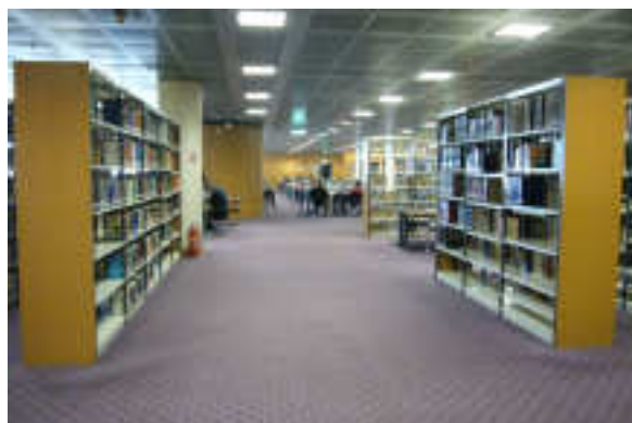
Socialinių mokslų skaitykla

Dokumentų tvarkymo skyriaus darbuotojai, supažindindami su skyriaus darbu, džiaugėsi patogia suplanuotomis darbo patalpomis. Dar prieš projektuojant bibliotekos pastatą buvo nuspręsta, kad dokumentai turi būti tvarkomi eiliškumo seka. Tvarkymo skyrius (komplektavimas ir katalogavimas) išdėstytas vienoje erdvėje. Dokumentas, patekęs į biblioteką, iki galo sutvarkomas vienoje vietoje. Skaityklos ir fondai gauna visiškai sutvarkytus dokumentus. Specializuoti skyriai leidinius tvarko patys.